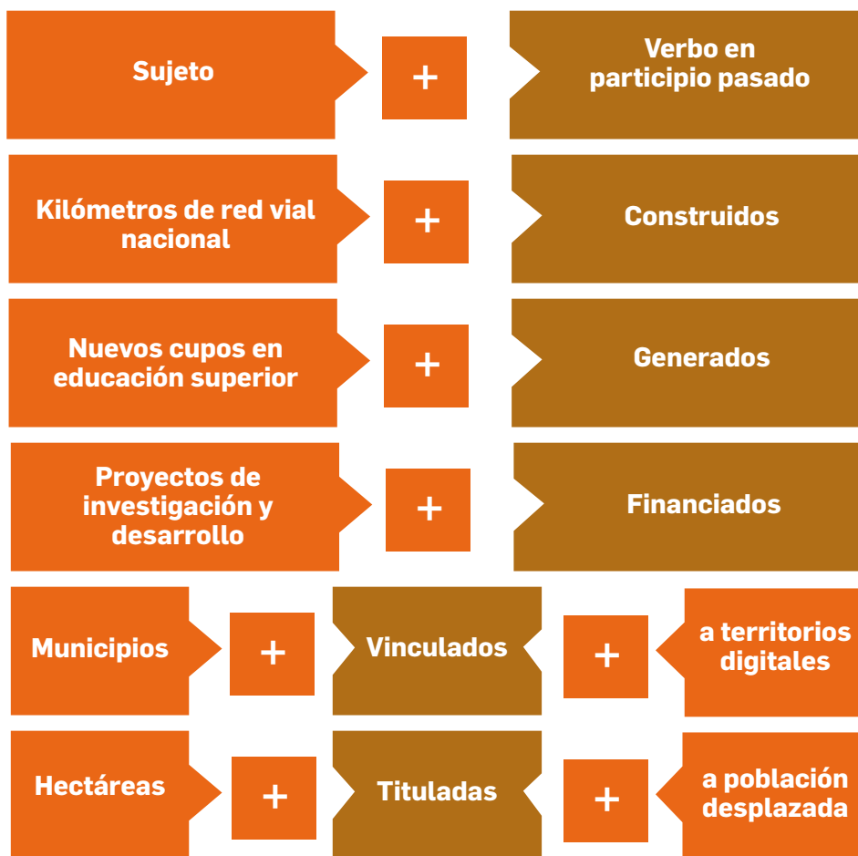
Diagrama 2 28 Ejemplos estructura del indicador